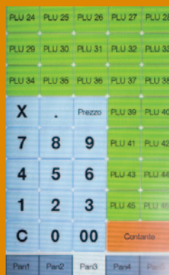
5 pagine programmabili