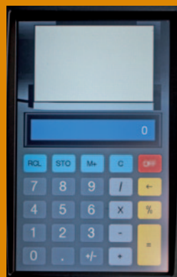
Calcolatrice con stampa